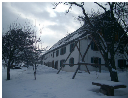
Hiver : pneus neige ou chaînes