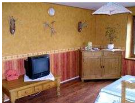
Séjour - cuisine