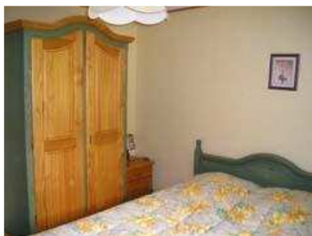
Chambre 1 : 1 lit 140x200