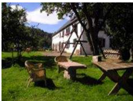
Maison côté « Gîte »