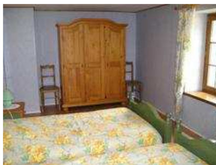
Chambre 2 : 2 lits 100x190