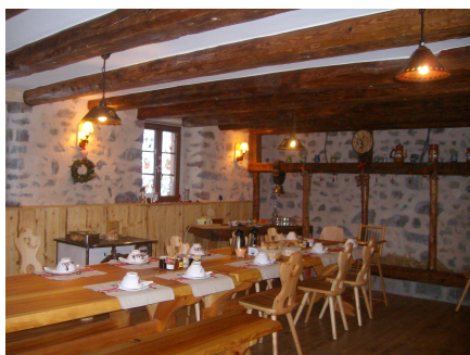
Salle à manger des propriétaires où sont Servis les petits-déjeuners « fermiers »